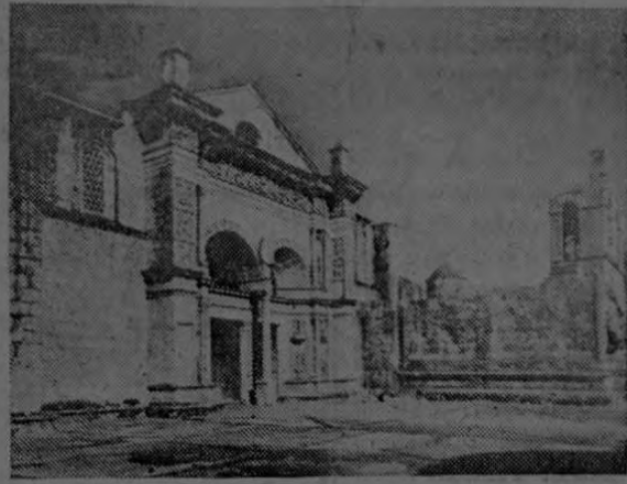
La Catedral de Santo Domingo, la Primada de América, hoy Basílica de Santa María, donde reposan los restos de Cristóbal Colón.

Compre en los establecimientos que anuncian en este periódico de la mujer.